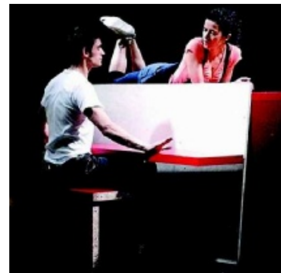
Un momento dello spettacolo in scena al Mil